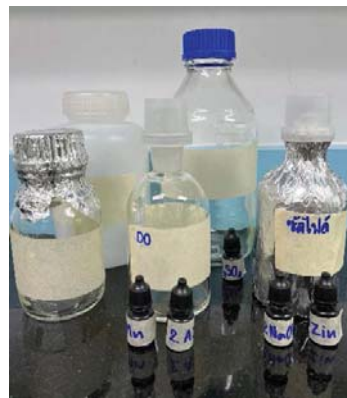
ขวดเก็บตัวอย่างน้ำ