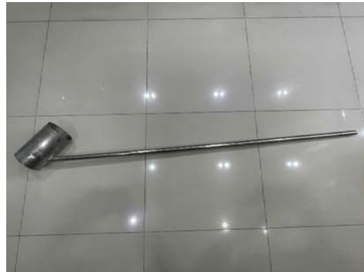
กระบอกรับตัวอย่างน้ำ